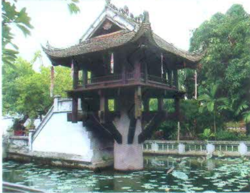
CHÙA MỘT CỘT - HÀ NỘI