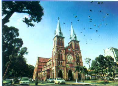
NHÀ THỜ ĐỨC BÀ - TP.HCM