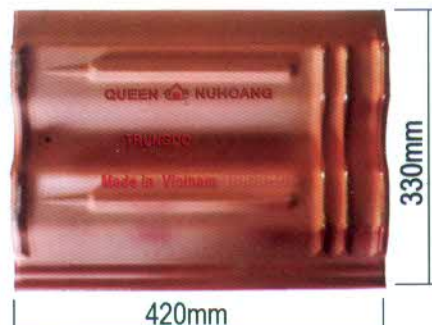
MẶT SAU NGÓI NỮ HOÀNG