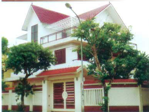
BIỆT THỰ - VINH