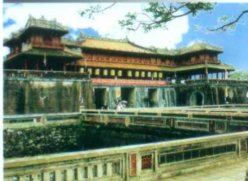
CÔ ĐÒ - HUẾ