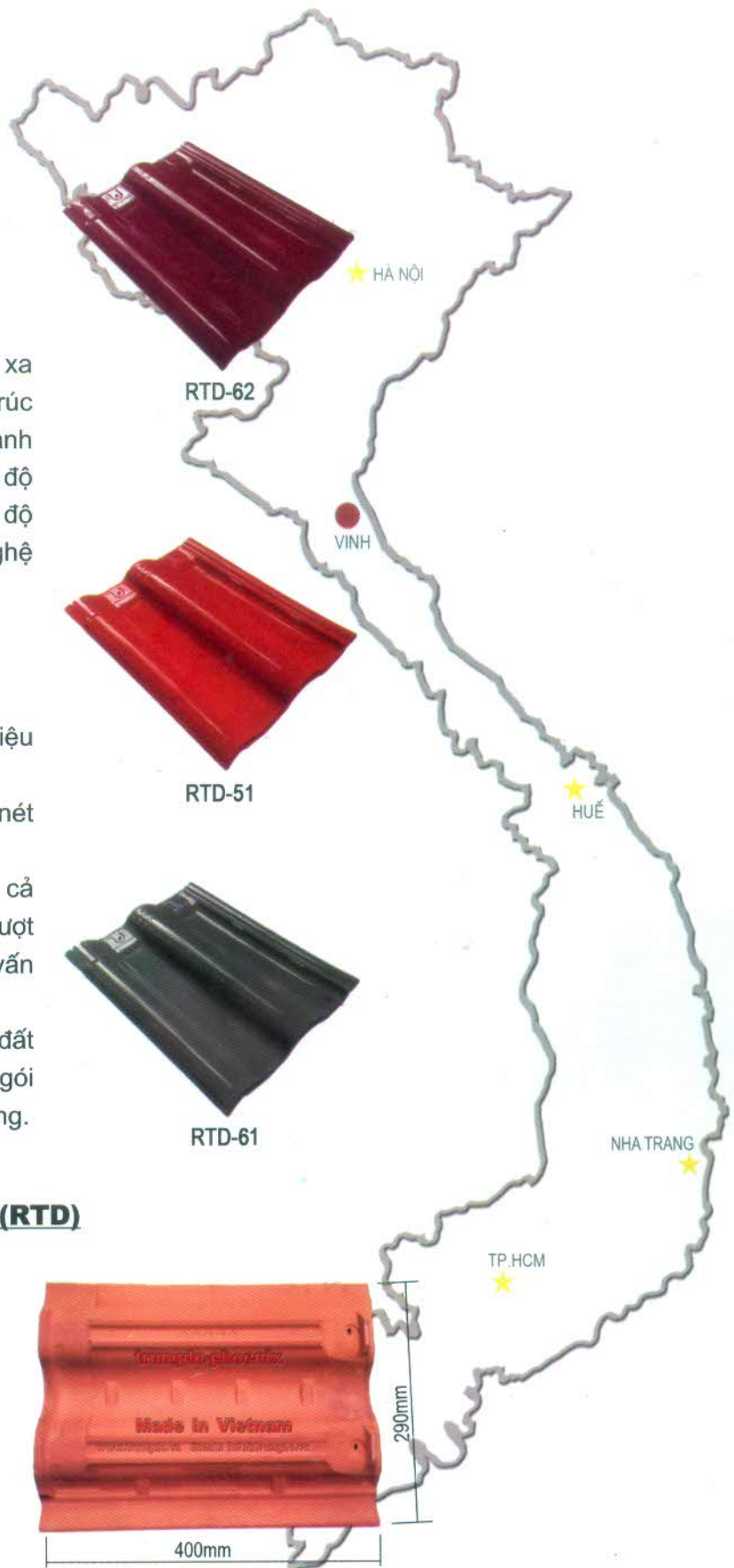
MẶT SAU NGÓI PHƯỢNG HOÀNG

Màu sắc của viên ngói chỉ mang tính chất tham khảo tương đối so với thực tế